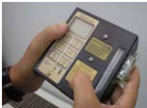
Φορητή αντλία για δειγματοληψία αερομεταφερόμενης σκόνης

Η συγκέντρωση της σκόνης (σε \text{mg}/\text{m}^3 ) προσδιορίζεται με επί τόπου δειγματοληψία αέρα από το εργασιακό περιβάλλον.