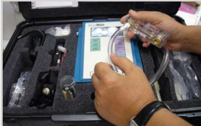
Συσκευή για τον on-line υπολογισμό της συγκέντρωσης σκόνης στους χώρους εργασίας